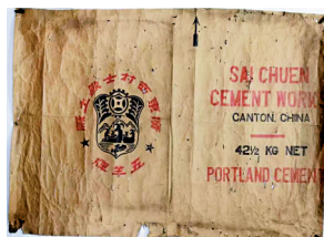
■民国广东西村士敏土厂五羊牌包装纸。

1917年和1923年,孙中山两次借用该厂办公楼作为大元帅府驻地,开府办公,建立革命政权,开展护法运动和东征北伐,实现国共合作。广州大元帅府旧址不仅是全国重点文物保护单位,也是中国共产党首次成功运用“统一战线”这