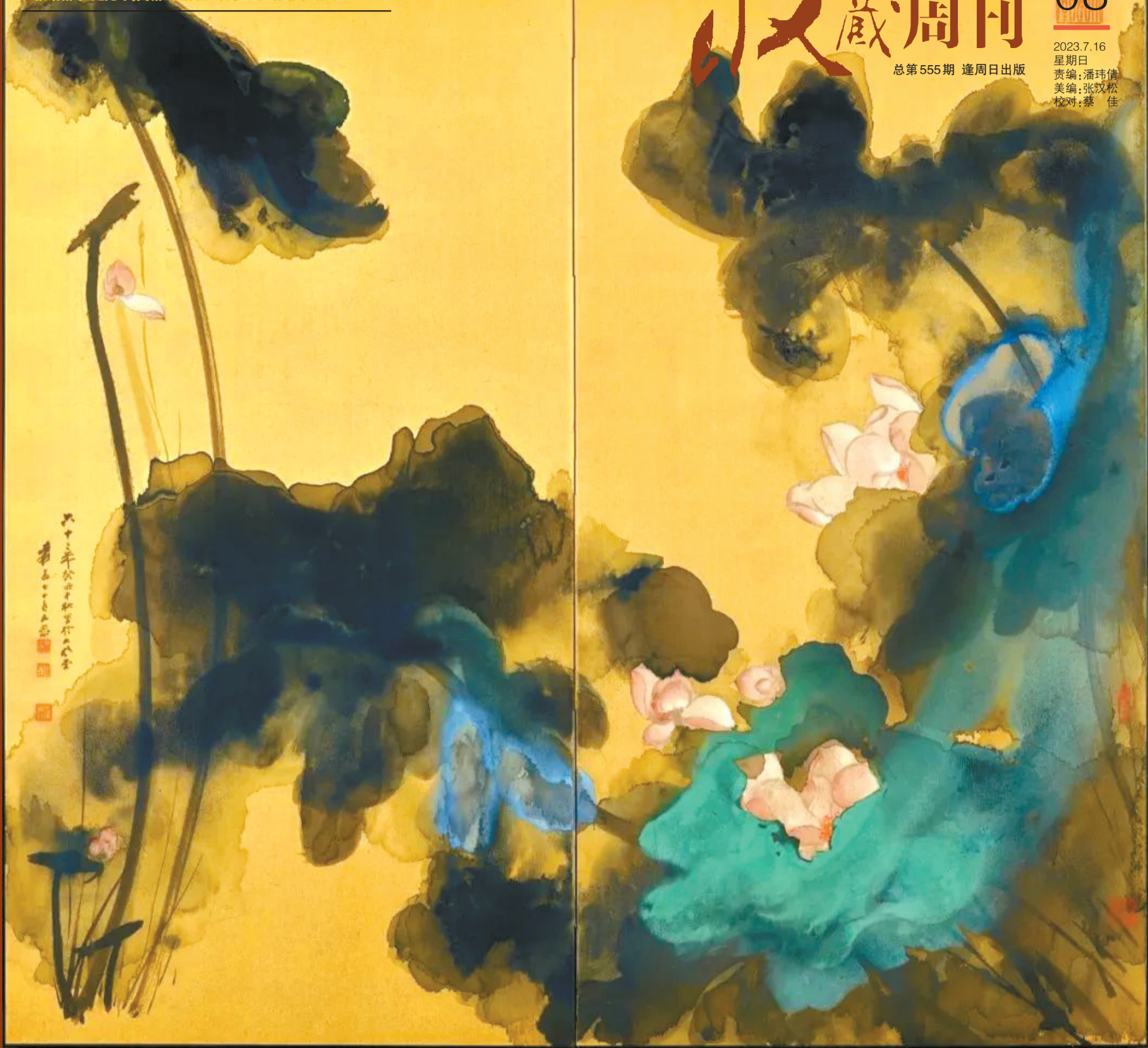
■4月5日,张大千的《花开十丈影参差》在香港苏富比春拍,以2.5亿港元成交。