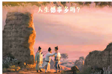
人生憾事多吗?——电影里的中年李白问他的朋友高适、杜甫