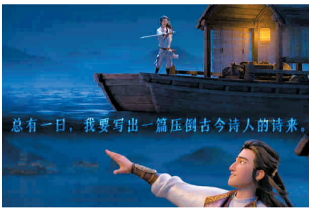
总有一天,我要写出一篇压倒古今诗人的诗来。——电影里的少年李白