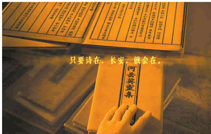
只要诗在,长安,就会在。——电影里的老年高适在抚摸《河岳英灵集》