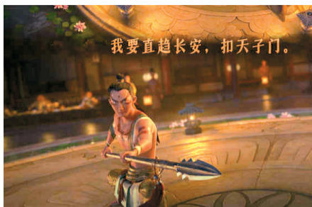
我要直趋长安,扣天子门。——电影里的少年高适