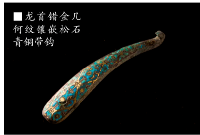
■龙首错金几何纹镶嵌松石青铜带钩

记者从浙江省博物馆官方公众号获悉,2023年7月20日-8月30日,瑰意琦行——中国古代带钩展将在浙江省博物馆孤山馆区精品馆举行。