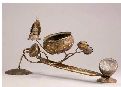
■宋,莲花宝子香炉,南京市博物馆总馆藏

莲荷,寻常亦风雅,它绽放在盛夏荷塘,它常驻于烟火日常,它化身为器用装饰,它承载着人文精神。记者从四川博物院官方公众号获悉,该院“盛世莲开——中国文化中的莲荷意象特展”,6月9日-10月8日在临展2/3厅举行。展览汇聚全国44家文博单位的218件精品莲荷文物,从不同角度展示了莲荷器物的典雅。