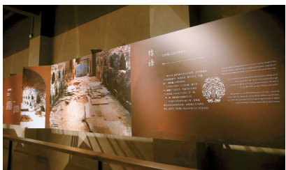
■遗址之上,一个精心打造的展览,加深着康陵遗址的文化内涵。