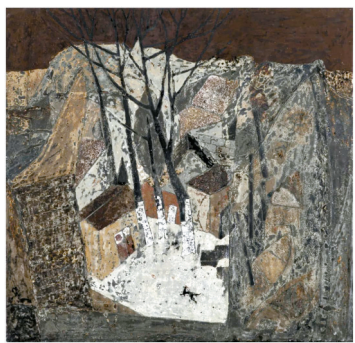
■吕庆河《七街·雨后》,漆画