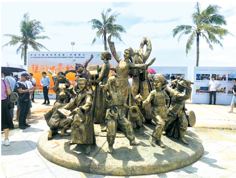
■许鸿飞雕塑作品《民族大团结》

全国政协委员、中国美术家协会理事、广东省美术家协会副主席、广东省人民政府文史研究馆馆员、国家一级美术师许鸿飞透露,这几乎是自己策划时间最短的一次展览。“我的雕塑与南海Ⅰ号所代表的文化均有一个共同点,就是中华文化走出去。在南宋期间的南海Ⅰ号是准备向世