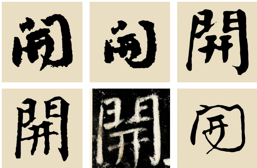
■颜真卿《元结碑》上的“开”字