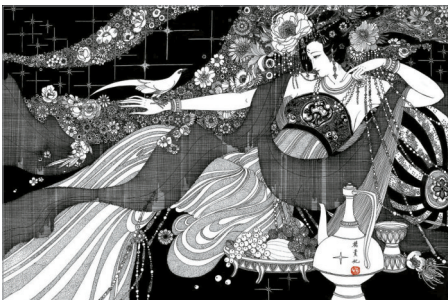
■《一百仕女图》中的杨贵妃,图中大小不一、密密麻麻的点,流畅潇洒、密不透风的线,全是一笔一笔手绘的,看起来十分震撼,让人不由得感叹卢延光炉火纯青的笔尖功夫。