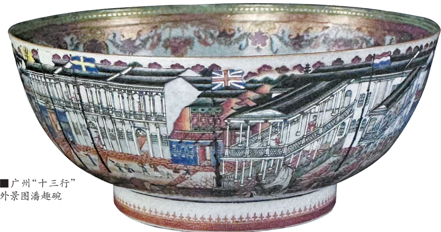
■广州“十三行” 外景图潘趣碗