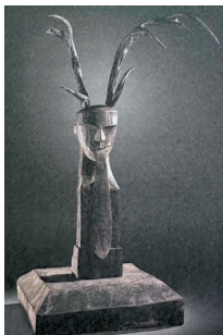
■楚人面鹿角镇墓兽

楚文化初起于江汉地区,到战国时期,楚国几乎占据了整个中国南方地区,楚人的宗教文化中存在一系列奇特的人、动物或鸟合体的神祇或巫觋。而楚文化中的来世观及对神仙世界的构想,与之后的道教似有千丝万缕的联系,促成了秦汉时期中国北方地区宗教信仰的变化和文化交融。