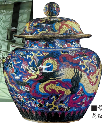
■景泰蓝云龙纹盖罐