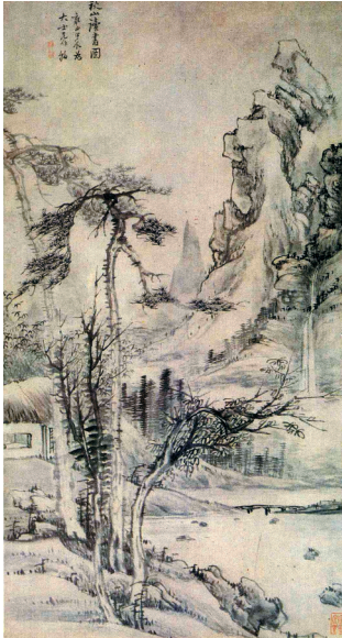
■《秋山读书图》,高凤翰