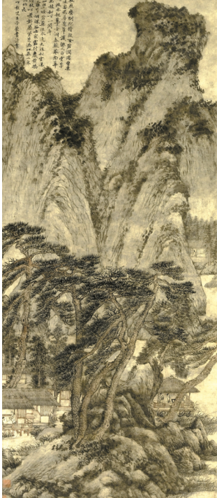
■《秋山读书图》,高凤翰