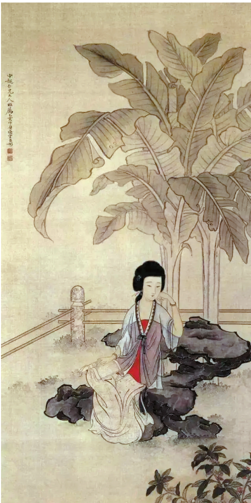
■《蕉荫读书图》清 吕彤 纸本设色 清华大学美术学院藏