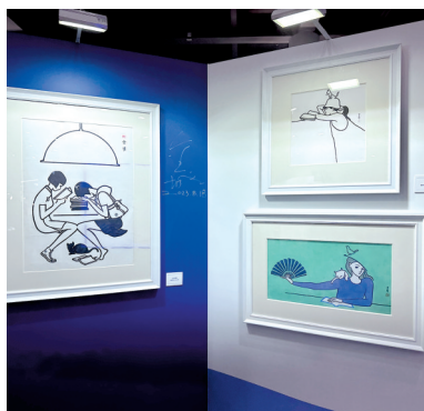
■展览现场的金城作品。

在潮玩IP展示区域,围绕“文化、潮流、艺术”而生的IP不胜其数:来自猩震互娱、潮玩宇宙平台的无聊猿(BAYC)数字藏品、数字潮玩领域当潮IP扭蛋兔、中国本土原创潮酷IP魔鬼猫、极具治愈感IP晓晓Duck、超大型气模何B仔、色彩丰富的异人类的肖像写真IP GoodGoodBoy、非遗醒狮概念IP-“STANROO我系狮泰隆”、洛阳龙门石窟文化IP鲤小龙……而近距离欣