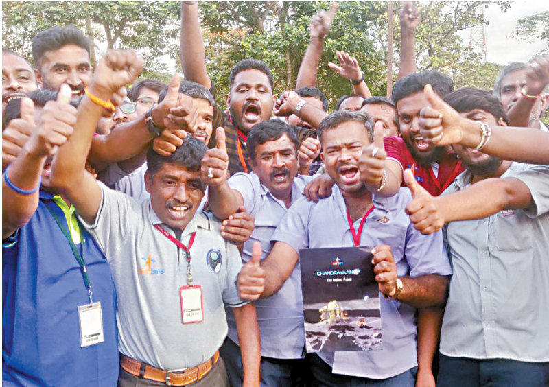
■8月23日，在印度班加罗尔，印度空间研究组织的工作人员庆祝印度月球探测器在月球南极成功着陆。

“月船3号”于7月14日发射升空，携带有月球着陆器和探月车。着陆器高约2米、重约1700公斤，探月车重26公斤。本月23日，“月船3号”携带的着陆器在月球南极实现软着陆。印度因此成为继苏联、美国和中国之后第四个实现探测器登月的国家。