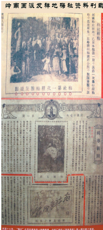
■1928年广州《海珠画报》曾报道过梅社第一次种梅的新闻。