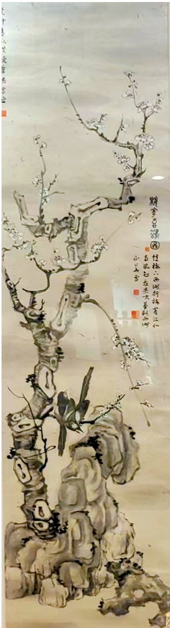
■叶正华 梅花喜鹊图