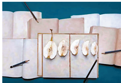
■曾沂聂作品《分裂研讨会》。