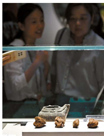
■嘉宾参观浙江余姚田螺山遗址出土的人工种植茶树根。