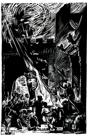
▲古元1947年作品《烧毁旧地契》，黑白木刻。