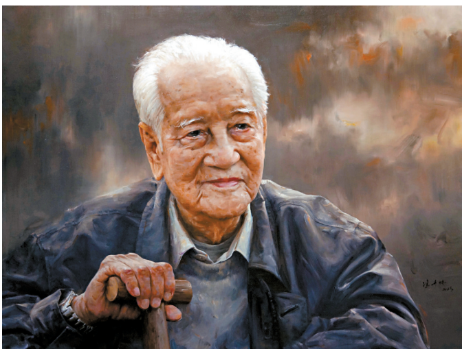
■冯少协作品《黄旭华——想起母亲的牵挂》。