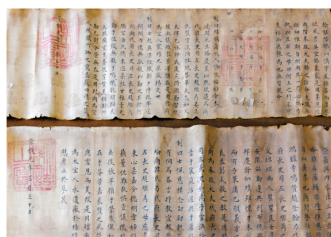
■新发现的两道崇祯年间圣旨。 新华社发