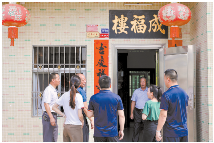
■驻汕尾市陆河县东坑镇工作队走访村民。