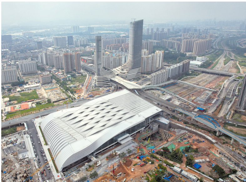
■广汕高铁全线设8个站,预计将于本月底前开通运行。图为建设中的新塘站。

广汕高铁计划本月内通车,对助推粤东地区加快融入粤港澳大湾区,构建深汕特别合作区综合交通体系,方便大湾区人民群众出行、打造广州“1小时生活圈”具有重要意义。