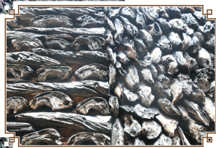
▲蚝壳墙的蚝壳比一般的长和大,左侧:罕见的一顺一丁砌法;右侧:常见的丁砌法