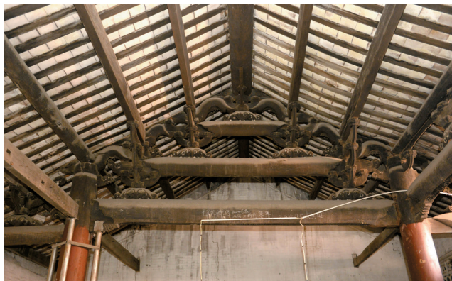
▲岷峨卫公祠内完整的木构梁架。