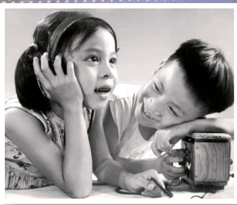
■梁伯权《你听到了吗?》1960年