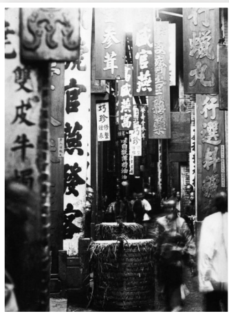
■赖阿芳《广州药房街》1880年