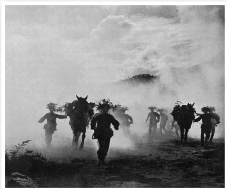
■崔柏桦《越过封锁线》20世纪50年代