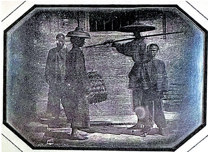
■《广州街头的市民》,达盖尔法银版照片,16.7cm×20.7cm,(法)于勒·埃及尔摄,1844年11月。法国摄影博物馆馆藏

日前,《广东艺术史》系列之《广东摄影史:1844-2020》正式发布,此举不仅填补了省级地方摄影史的空白,而且在摄影史学的学术研究上为编撰地方摄影史提供了可资借鉴的样板。著名摄影评论家、九十岁高龄的丁遵新认为其“开地方与全国摄影史(书写)之先河,难得!”