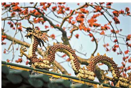
■龙腾南天 木棉红 ——陈俊生