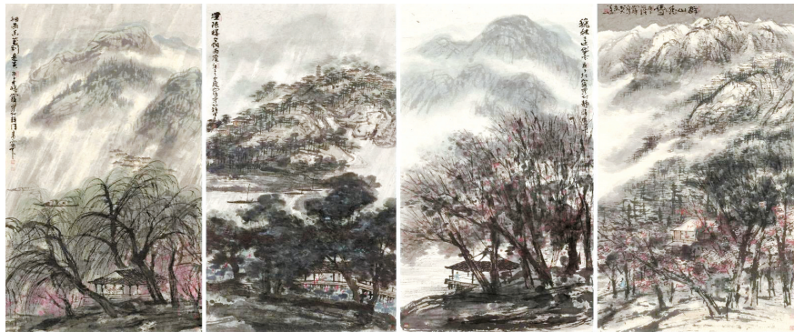
■北京永乐2021年春季拍卖首日,崔如琢巨幅山水四条屏以1亿元起拍,最终以3.45亿元成交,刷新了崔如琢个人书画作品拍卖的新纪录。

连续八年《胡润中国艺术榜》蝉联榜首、曾给故宫博物院捐献1亿元人民币……崔如琢几乎成为最受关注的在世画家之一,但他作品的屡次天价成交,同样为他带来了不少质疑的声音,其中不乏“炒作”等字眼,日前,他携同自己的“版画”作品与广州市民见面,在现场,现为故宫学院中国画研究院院长的崔如琢,对相关网络流传的话题——作了回应。