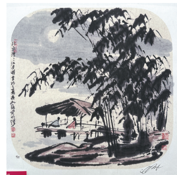
■江水澄澄月明 崔如琢 版画

我认为,选择什么样的板块,然后按标准去做就行了,不要互相排斥,不要互相否定,应该互相吸取各方的优点来丰富自己,我觉得国画才能发展得更好。