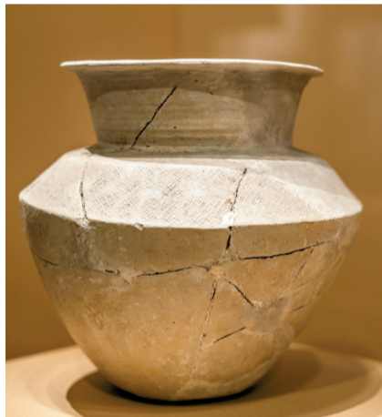
■原始瓷尊,商代,1983年盘龙城王家嘴82探方8层出土,盘龙城遗址博物院藏。