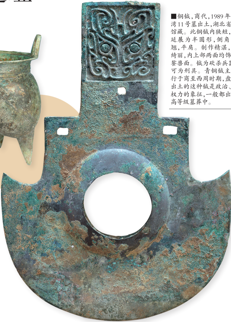
■铜钺,商代,1989年杨家湾11号墓出土,湖北省博物馆藏。此铜钺内狭短,刃部延展为半圆形,侧角向上翘,平肩。制作精湛,纹饰绮丽,内上部两面均饰一饕餮兽面。钺为砍杀兵器,也可为刑具。青铜钺主要流行于商至西周时期,盘龙城出土的这种钺是政治、军事权力的象征,一般都出土于高等级墓葬中。