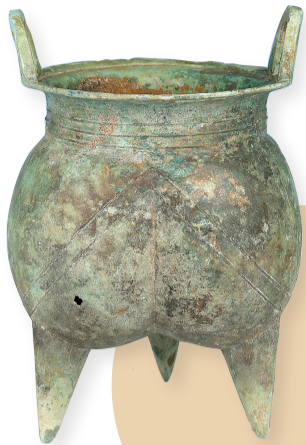
■弦纹铜鬲,商代,1974年盘龙城李家嘴1号墓出土,湖北省博物馆藏。器物通体经过修整磨光。折沿,口立对耳,鼓腹,曲底分裆。腹裆部饰三个三角纹,颈部饰三道平行弦纹,国家一级文物。鬲是炊煮器。

盘龙城遗址位于湖北省武汉市北郊的盘龙城经济开发区,是长江流域已知等级最高、遗迹最丰富的商代前期遗址,距今约3500年历史,被誉为“武汉城市之根”。遗址包括宫城区、李家嘴、杨家湾、杨家嘴、王家嘴等多个地点,总面积3.95平方公里,出土了大玉戈、青铜大圆鼎、青铜钺、绿松石镶嵌金片饰件等3000余件精美文物。