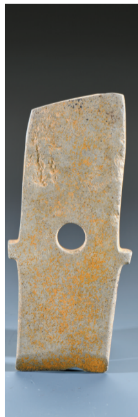
■石璋,商代,广州黄埔竹园岭遗址出土,广州市文物考古研究院藏。基本完整,器体中部偏下钻孔。两侧有突出的锯齿。一端有刃,另一端未开刃。通体磨制精细。