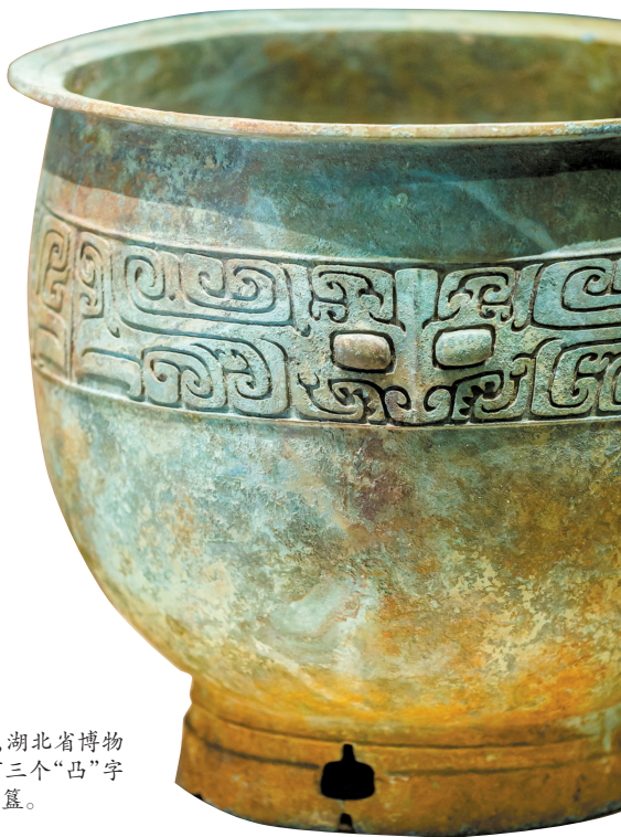
►兽面纹铜簋,商代,1974年盘龙城李家嘴2号墓出土,湖北省博物馆藏。器身饰弦纹、饕餮纹。饕餮目方形凸起。足部有三个“凸”字镂空。盘龙城出土的青铜簋是目前发现最早的商代青铜簋。