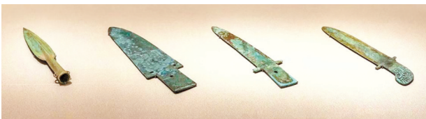
■盘龙城遗址出土的铜矛、铜钺及铜戈

其次是出土的青铜兵器。在盘龙城遗址出土的青铜器中,兵器的数量约占三分之一,且大部分墓葬都有青铜兵器随葬,器类计有戈、矛、刀、钺等,出土数量之多中原地区商墓所不及。这说明盘龙城拥有一支用先进武器武装起来的强大军队。