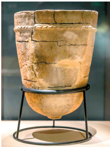
►陶缸,1980年代盘龙城王家嘴采集,盘龙城遗址博物院藏

关于盘龙城的性质问题,至今学界还没有统一的看法,相信未来随着盘龙城的继续发掘,我们对它的认识能够逐渐清晰,谜团也将会有解开的一天。