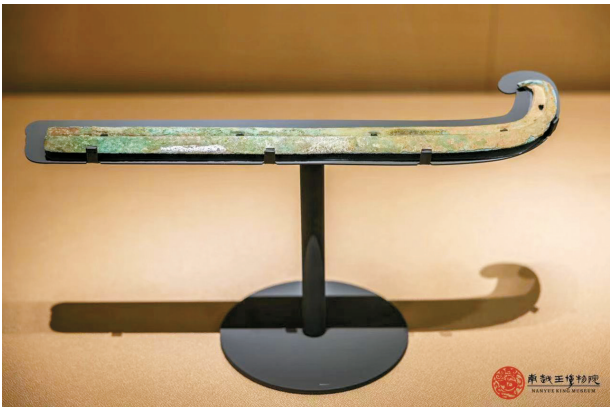
■铜勾刀,1989年盘龙城杨家湾11号墓出土,湖北省博物馆藏