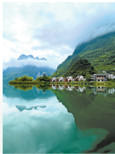
■浩坤湖静谧而秀美。