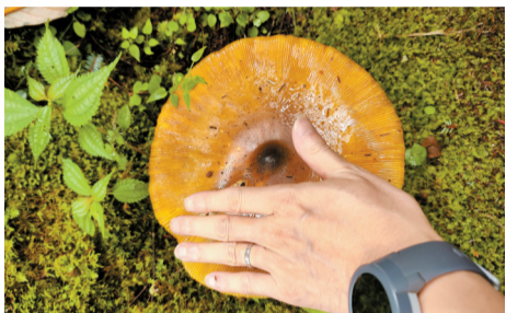
■罗古箐遍地的蘑菇。

“罗古箐到大羊场有24公里徒步路线,沿途景观包括高原牧场、原始森林、湿地、花海、丹霞石林等,天然不加雕饰,纯净无世俗喧嚣,适合放空。没有旅行团,没有让你挑花眼的攻略,藏在深山人未识,一句话:此处美景绝佳,带上户外装备,去就对了!”