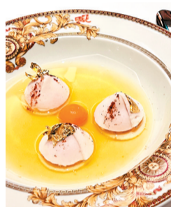
■佳肴充满那不勒斯风味。