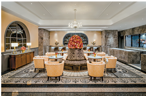
■餐厅设计极具范思哲的意式奢华风。

总厨擅长在意大利传统家庭美食的基础上,结合时令新鲜蔬果的味型特点,让味道层次变得更加丰富。以一道意式布列塔尼蓝龙虾水牛芝士串为例,选用法国蓝龙虾入饌,用低温慢厨方式处理,龙虾味道鲜咸,肉质爽嫩弹牙,搭配意大利水牛芝士原本口感已经很丰富,又因特别加入了用有气酒跟白桃制作的清甜啫喱,令整体呈浓郁而不腻、鲜咸而不失清甜的丰富口感。餐后,奶酪车、甜点车和咖啡车轮番推来,把南意大利特有的热情呈现得淋漓尽致。