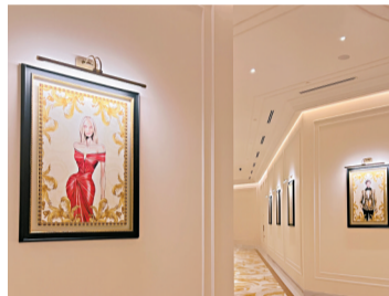
■在前往“当奥丰素 1890”的路上可以欣赏到范思哲服装设计手稿。