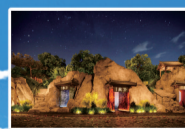
温泉五龙洞效果图