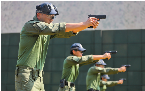
■战术手枪射击场地,来自香港警队的选手在进行空枪基础练习。