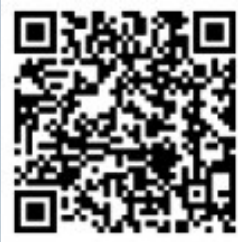
扫码打印获奖证书