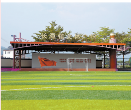
■ 长潭镇文体广场整饬一新。