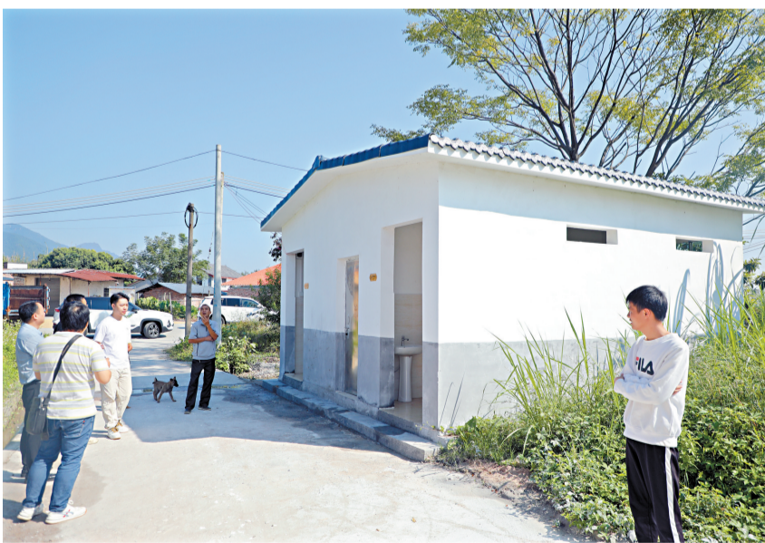
■ 乳源按三类公厕以上的标准,在21条自然村(社区)各建1座公厕。

在烈村村委会后面,一座白色公厕粉刷一新,男女厕门口挂着醒目标记,公厕内的地面和内墙都由瓷砖铺砌,顶端处安装了两盏太阳能照明灯,公厕内还配备了洗手台和洗手液,整个公厕干净整洁、舒适。烈村还为公厕制定了“管护和保洁制度”,由村委会主任担任“所长”,要求公厕每天保洁次数不少于2次,定时巡检、维护,确保无明显臭味,公厕地面光洁、无积