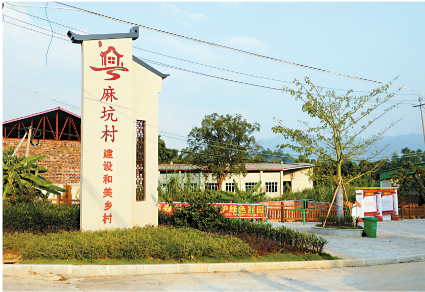
■ 麻坑村的党建小公园成了长潭镇一道靓丽的风景线。

广东省乡村振兴基金会的捐赠资金,让长潭镇的基础设施有了很大提升:在X046县道,共计9公里长的几个路段结束了入夜即陷“昏黄”的过去,200盏太阳能