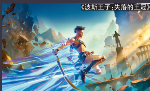
《波斯王子：失落的王冠》

马两大主角都将亮相,为玩家带来全新的故事体验。此外值得一提的是,该作中包含有大量迷你游戏,包括《疯狂出租车》和《宝可梦》。此外,还新增了模拟经营玩法,玩家可以发展自己的岛屿。本作将在PS5、PS4、Xbox和PC平台上发售。