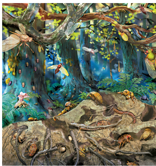
■中生代森林中蝉的生活生态场景示意图。杨定华/绘制