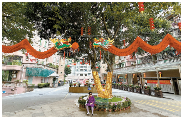
■海珠区新港街某小区内挂起了双龙戏珠的彩灯,十分喜庆。