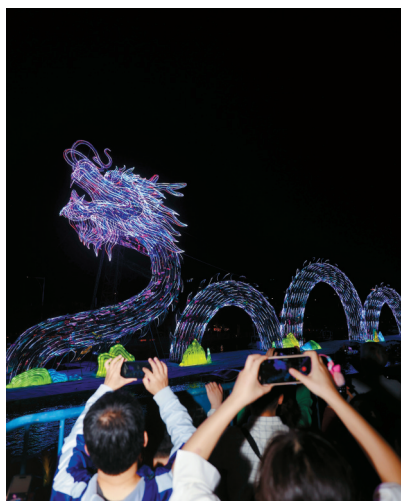
■越秀公园新春灯会亮灯,千年越秀山张灯结彩、流光璀璨、绚丽壮观。

记者在广州街头走访时,看到一对情侣正在双龙戏珠的彩灯下留影。一番询问得知,原来他们准备在第二天领证结婚。他们看到喜气洋洋的两条龙,觉得它美好的寓意是在祝福他们的爱情一样,于是在双龙戏珠的彩灯前定格这个美好的时刻。