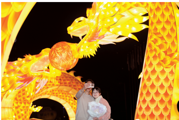
■一对情侣在双龙戏珠的彩灯前定格下美好的时刻。