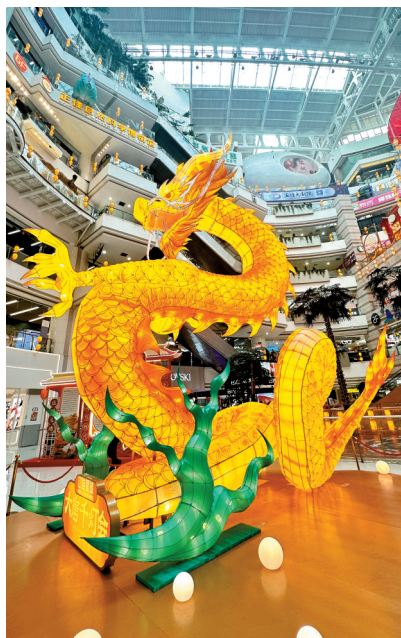
■天河商圈一商场内,一条巨型的龙形花灯十分惹眼。