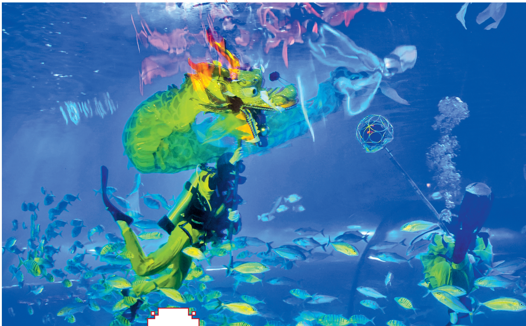
■广州天河一景区为了结合龙年主题在水底进行舞龙表演,吸引了不少游客的目光。