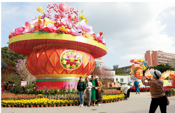
■广州文化公园迎春花会内龙形花灯随处可见,市民纷纷拍照留念。