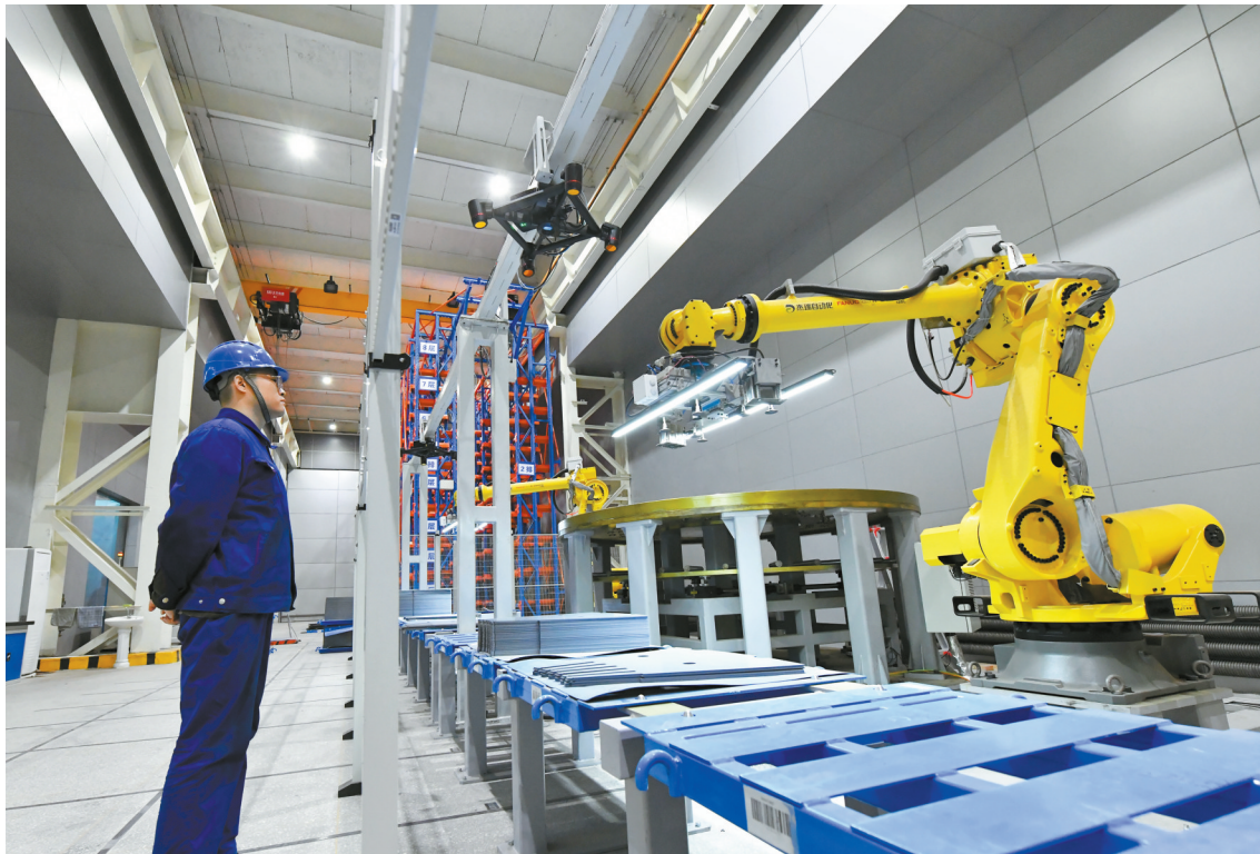
■在汽轮发电智能叠片间,工作人员在观察智能设备运行情况。