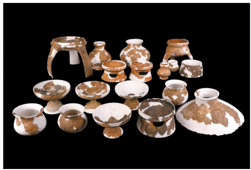
■ 高等级墓出土石峡文化陶器组合