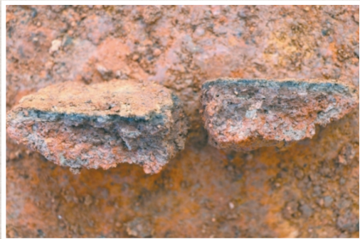
■ 建筑遗迹烧土块中的水稻遗存