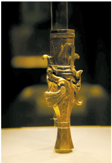
■金罍,中山王“厝”墓出土,河北省文物考古研究院藏

日前,由南越王博物院(西汉南越国史研究中心)、河北省文物考古研究院(河北省泥湾湾研究中心)、河北博物院联合主办的“千乘中山——古中山国精品文物展”在南越王博物院王墓展区正式开幕,此次展览选取了175件/套中山国具有代表性的出土文物进行展出,其中,行唐故郡遗址出土的部分文物为首次展出。该展览将持续至6月16日。