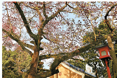
■“木棉王”迎风怒放,满树红花灿若烟霞。