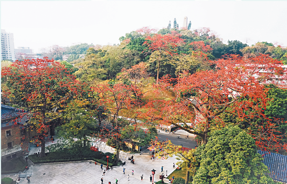
■广州中山纪念堂的“木棉王”已有350多岁。

3月,是木棉花开的季节,这株“中国最美木棉”迎风怒放,8万朵花挂满枝头,红如焰火,灿若烟霞。老广称:“英雄花开英雄城。”