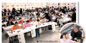
第七期“翰墨青春·传承的印记”青少年书画大赛佛山分赛区现场挥毫大赛

【佛山日报·佛山讯】由佛山市文联、佛山市书画家协会、佛山市青少年宫联合主办的“翰墨青春·传承的印记”青少年书画大赛，日前在佛山市青少年宫举行。本次比赛吸引了众多青少年参加，现场气氛热烈。经过激烈角逐，一批优秀作品脱颖而出，赢得了评审团的一致好评。