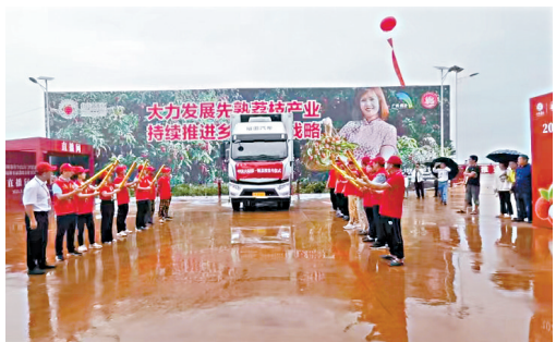
■2023年5月,“中国大陆第一颗荔枝”发车仪式。