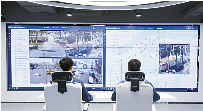
■南方电网广东珠海横琴供电局成功接入合作区公共视频平台,政数对接赋能数字运维再提升。

近年来,广东省防范和打击涉电力违法犯罪中心坚持以“以打开路,打防结合”的工作方针,适时开展全省或区域性专项联合打击行动,推动打击涉电力违法犯罪行动常态化实施。2023年3月,