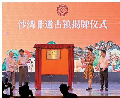
■沙湾非遗古镇揭牌仪式。

其中,广州非遗开放日以广州非遗“五在”工程(在景区、在博物馆、在校园、在商场、在社区)为切入点,在6月1日至10日期间举办192场开放日活动,创历年活动数量之最。广州非遗购物节将贯穿整个6月份,包括多场非遗直播带