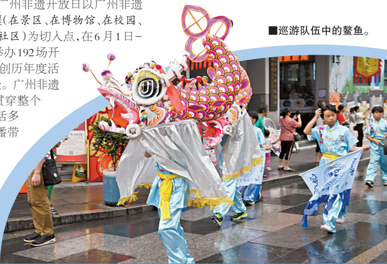
■巡游队伍中的鳌鱼。

今年适逢粤剧被联合国教科文组织列入人类非遗代表作名录15周年,粤剧优秀民间团体演出季将在广州市文化馆举行多场粤剧私伙局演出、粤剧在校园成果演出、粤剧主题讲座等活动。