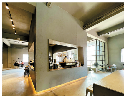
■来回咖啡钟村店，每个角落、不同角度都很容易出片。

如果是从地铁7号线的A1出口出来，便是曾经的工业园区了，近些年这里实施活化改造，引进了一些咖啡、美食的休闲空间，在外表看上去依旧比较“工业风”的肌底下，流动着时尚小资的腔调。