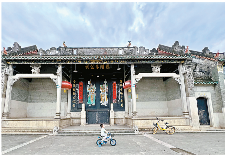
■襟湖李公祠是番禺区现存规模较大、保存较好的祠堂之一。