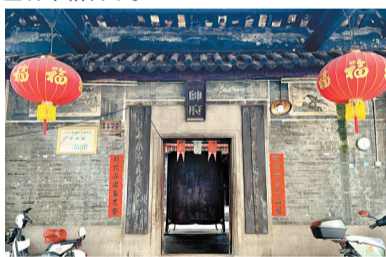
■方帅庙对面水坑有“谢恩桥”，至今尚存。