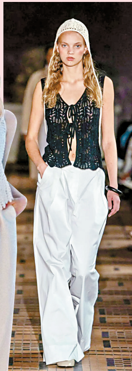
◀叠穿时建议选择相近色的内搭,这样无论什么时候造型都不会出错。