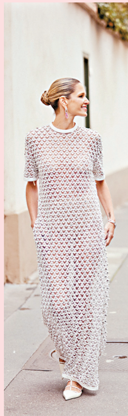
▲几何镂空钩织连衣裙即便覆盖全身,清凉感依然在线,腰带可分出腰线,也更有风情。