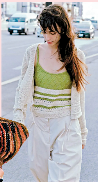
▲用撞色的钩织背心作内搭,可以轻松点亮整体的造型穿搭。

◀最好入门的单品还是配饰如钩织包、钩织头巾、钩织帽等,首选撞色,亮眼出彩又适合夏天。