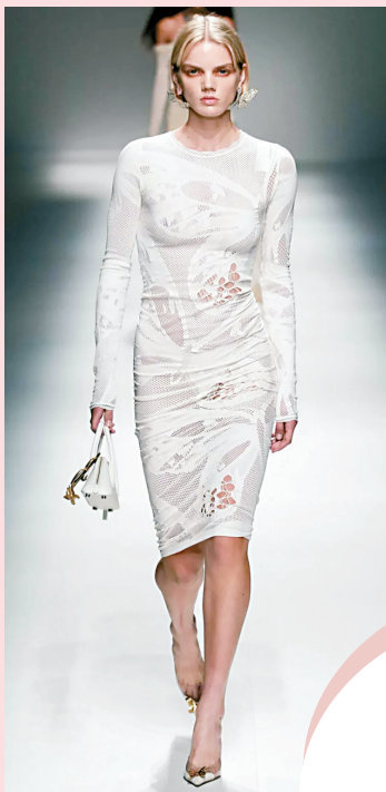
▲大小不一的镂空可在平面基础上错落打造出整体造型的层次感。

立体花朵钩织让钩织单品摆脱了“容易没型”“不显质感”的特点,同时又增加了一定的膨胀感,实际上并不是那么好驾驭。可以选半立体款式或平面图案与立体图案相结合的款式,在适当位置展现身材曲线,“起伏有致”才更能展现搭配功力。