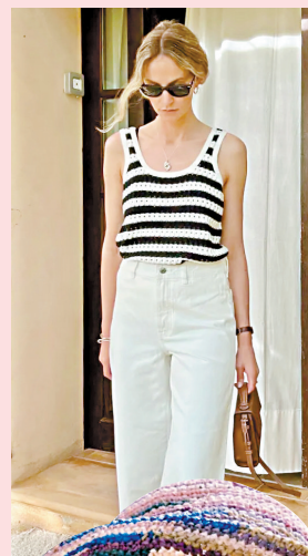
◀条纹、格纹图案的钩织背心,既有撞色的活泼感,又属于基础百搭款,度假感也很强。

需要注意的是,在选择撞色钩织单品时要避免选洞太大、领口和下摆又很收缩的款式,容易让整体造型显得很膨胀。