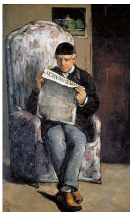
■塞尚《读报的父亲》1866年