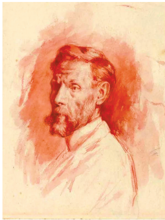
■毕加索《艺术家的父亲》纸上水彩