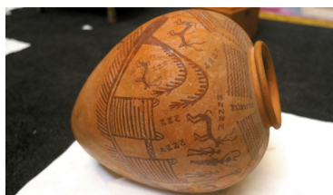
▲5月23日在位于埃及首都开罗的埃及国家博物馆拍摄的将要打包的陶罐。新华社发