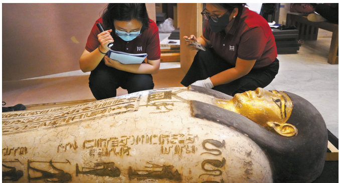
▲5月23日,在位于埃及首都开罗的埃及国家博物馆,上海博物馆的工作人员对一件木乃伊棺盖进行检查。

来自新华社的消息显示,近日,位于埃及首都开罗的埃及国家博物馆有些热闹。馆内一层的几个展厅内外,摆放着数十个大型板条箱,引得参观者频频驻足。