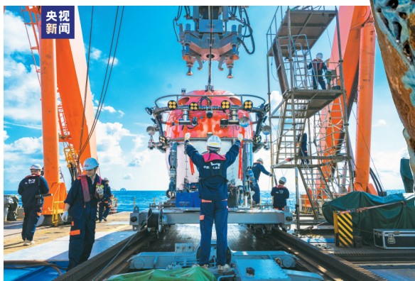
▲载人潜器布放。

象形执壶、珐华梅瓶、青花人物纹罐……今天,凝视着这一件件精美的文物,如同打开了一个个封存百年的“时光宝盒”。数百年前,这片蓝色海域上往来不息的商船、漂泊远游的船客,仿佛跃然于眼前,与我们展开了一场跨越时空的对话。