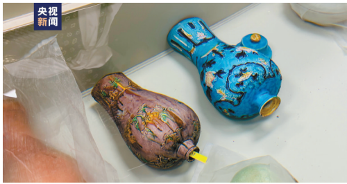
▲出水文物。