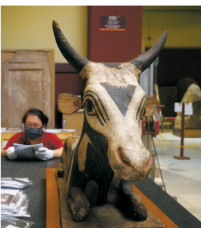
►5月23日在位于埃及首都开罗的埃及国家博物馆拍摄的一件将要打包的文物。