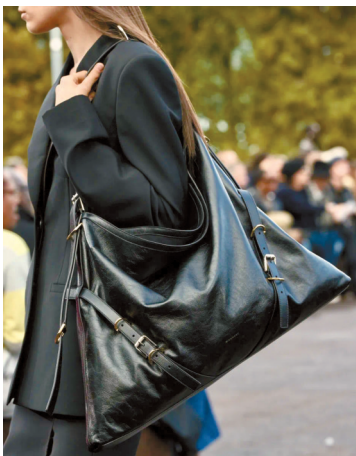
▲带金属装饰的新月包,包身更硬挺有型,精致度大增,正式场合也不失礼。