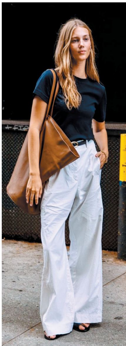
▲大软包给人轻松而不失精致感的氛围。