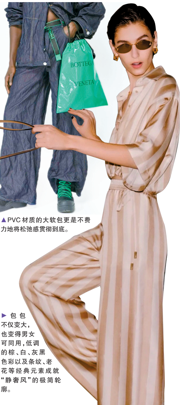
►PVC材质的大软包更是不费力地将松弛感贯彻到底。