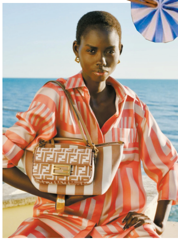
▲今季新的包袋搭配思路是,将同色系小包挂在大包肩带上,实用同时打造搭配层次感。