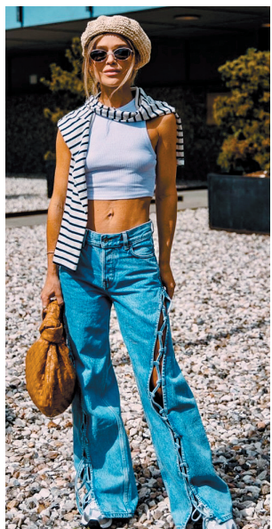
▲以三角形为主的手拎包也属于这类包形,整个形状有如打了结的“垃圾袋”,彰显特别。