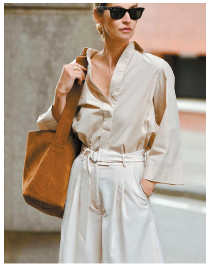
►横版的包形不容易压个子,对小个子时髦精比较友好。