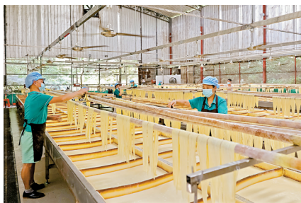
■小三江镇的腐竹加工产品供不应求,稳定带动群众种植大豆等增收。