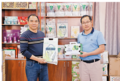
■驻迳头镇工作队扶持镇属国企佛冈迳头拓远建设有限公司经营,去年实现利润约110万元。