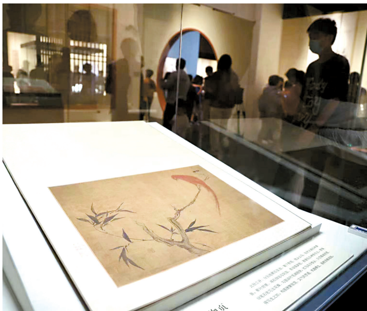
■展览展出了近70件/套馆藏精品力作。

展览融合展示、研究、教育于一体,注重让文物活起来。数字化技术助力陈列展示,打造沉浸式观展体验,让观众走进华岳画作,游览山水,体验诗情画意。展览期间,粤博还将举办专家讲座、现场导赏等相关教育活动,开发一系列与华岳相关的可食、可用、可玩、可赏的文创产品,全方位多形式宣传华岳绘画艺术。