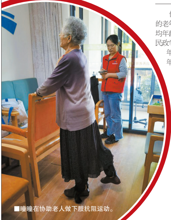
■瞳瞳在协助老人做下肢抗阻运动。