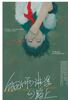
■《细雨淋湿的路上》的海报。

短片讲述了一家在5月20日的经历。这一天是“我爱你”的表白日。影片通过这一天的故事，展现了家庭成员之间的深厚情感和相互支持，传递了