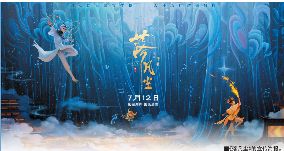
■《落凡尘》的宣传海报。