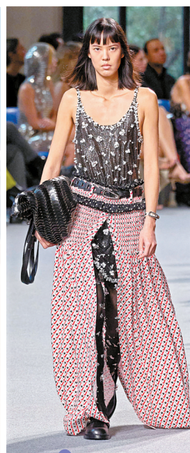
RABANNE 2024 秋冬时装秀