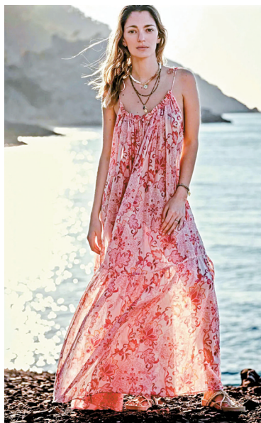
▲日常穿着波西米亚风要尽量将造型色彩或图案保持在三种以下。

▼如偏爱中性风,可尝试宽松衬衫或披肩背心搭休闲裤或牛仔裤,简约是关键,强调自然流露的个性与舒适自在的氛围。