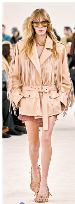
Chloe 2024 秋冬时装秀