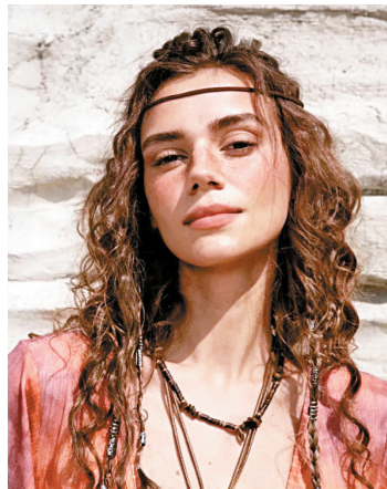
▲编织发型是经典波西米亚风的代表元素,可用来强化风格氛围。

鞋履搭配,波西米亚风作为舒适感主导的穿搭,轻盈与存在感不会过于强烈的细带凉鞋会是很好的配搭,而秋冬季,波西米亚风的代表牛仔靴更为贴合,粗犷的线条随性自由,与波西米亚风的核心调性契合。