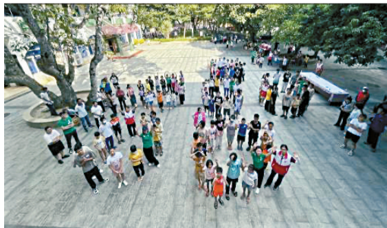
▲去年中秋大慰问的温暖场景。