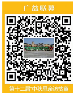
第十二届“中秋思亲访贫童” 捐款二维码

据了解,该活动已在慈善中国平台进行公开募捐备案,有意加入“祝福队伍”者,可“码”上行动。